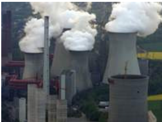
[Bildunterschrift: Braunkohlekraftwerk Neurath ]

Nach der Vorstellung des dritten Weltklimaberichts hat die EU-Kommission eindringlich vor dem Bau neuer Kohlekraftwerke in Deutschland gewarnt. "Braunkohle ist, was die Treibhausgase angeht, die ungünstigste Wahl", sagte EU-Umweltkommissar Stavros Dimas der "Bild am Sonntag". "Wer heute noch neue Kohlekraftwerke baut, muss sich im Klaren sein, dass eine solche Politik uns alle langfristig teuer zu stehen kommt. Auf mittlere Sicht sollten nur noch Kohlekraftwerke mit klimaverträglichen Technologien - etwa der Kohlestoff-Abscheidung - betrieben werden."