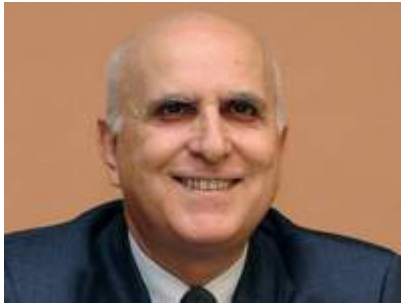
[Bildunterschrift: EU-Umweltkommissar Stavros Dimas ]

Nach der Vorstellung des dritten Weltklimaberichts hat die EU-Kommission eindringlich vor dem Bau neuer Kohlekraftwerke in Deutschland gewarnt. "Braunkohle ist, was die Treibhausgase angeht, die ungünstigste Wahl", sagte EU-Umweltkommissar Stavros Dimas der "Bild am Sonntag". "Wer heute noch neue Kohlekraftwerke baut, muss sich im Klaren sein, dass eine solche Politik uns alle langfristig teuer zu stehen kommt. Auf mittlere Sicht sollten nur noch Kohlekraftwerke mit klimaverträglichen Technologien - etwa der Kohlestoff-Abscheidung - betrieben werden."